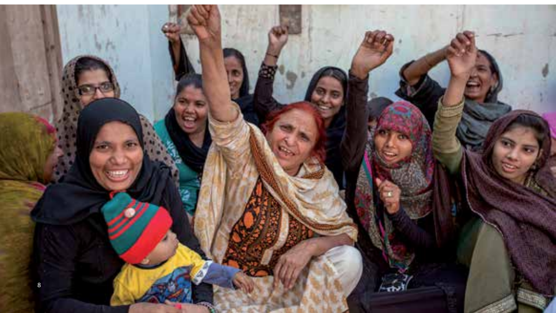
Foto links: De Home Based Women Workers Federation in Pakistan is een groep die Mama Cash steunt. Sinds jaren maken ze zich met succes hard voor wetgeving die thuiswerkers, voor 80 % vrouwen, beschermt (zoals minimum loon, sociale zekerheid, toegang tot arbeidsrecht bij conflicten).