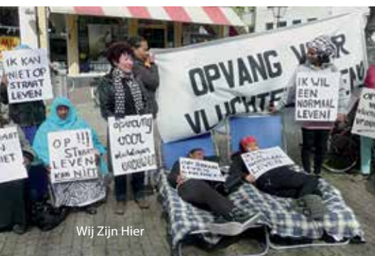
Wij Zijn Hier