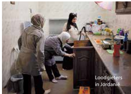
Loodgieters in Jordanië

Dus we onderzoeken voortdurend het effect om goede keuzes te kunnen maken. Niet alle situaties zijn geschikt voor hulp in de vorm van cash. Er zijn voorwaarden. De eerste is dat er een minimaal functionerende markt is, anders valt er niets te kopen. Als er niet voldoende te koop is krijg je ook prijsopdrijving als er veel cash in omloop is. Ook moet het geven van cash niet leiden tot veiligheidsproblemen voor de ontvangers. Dus die lokale en regionale situatie moet goed geanalyseerd en gevolgd worden. Libanon is bijvoorbeeld een land waar hulp in de vorm van cash goed werkt. In Libanon zijn heel veel Syrische vluchtelingen, die in miserabele omstandigheden in steden en dorpen leven. Ook in Jordanië woont 80% van de vluchtelingen in de stad. Belangrijk is ook een goede selectie van mensen die in aanmerking komen voor cash hulp. We geven niet alleen hulp aan kwetsbare vluchtelingen zoals huishoudens zonder kostwinner en alleenstaande moeders met kinderen, maar ook aan kwetsbare mensen in de gemeenschap. Door ook lokale mensen hulp te bieden en leiders uit de gemeenschappen te betrekken bij de hulp en uit te leggen wat de selectiecriteria zijn kan sociale cohesie worden versterkt. De gebruikers van