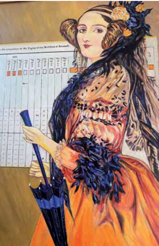
Countess Ada Lovelace: maakte in 1843 het eerste computerprogramma voor statistische gegevens